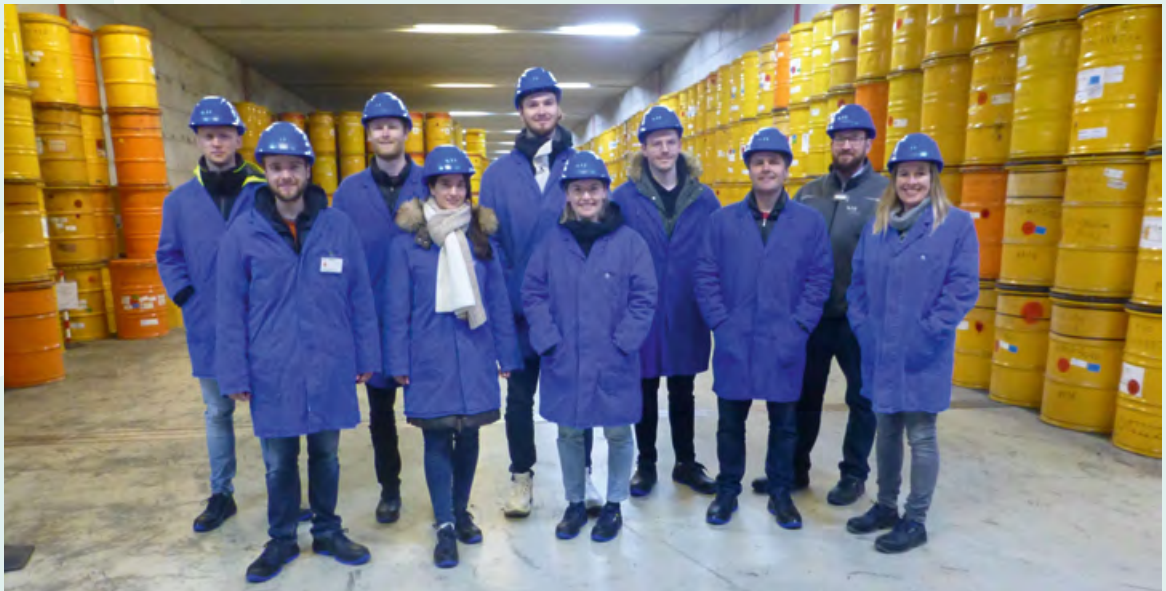
Besuche der KTE – Kerntechnische Entsorgung Karlsruhe GmbH im Rahmen der Vorlesung „Rückbau kerntechnischer Anlagen“

Entsorgungsarbeiten für bauliche und technische Anlagen selbständig zu planen, zu beantragen und vor Ort umzusetzen. Hierzu gehören die rechtlichen, technischen und praktischen Aspekte, angefangen von den Kriterien der passenden Verfahren über einen Abbruch- und Genehmigungsantrag, bis hin zu den entsprechenden Recycling- und Entsorgungsmöglichkeiten. Auch wird ein Überblick über die möglichen Schadstoffe (z. B. Asbest, Mineralfasern) und den entsprechenden Schutzvorkehrungen gegeben.