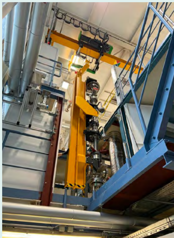
COSMOS-H Thermo-Hydraulik Versuchsanlage.

Um diese Fragen zu beantworten, betreiben wir einzigartige Laborinfrastrukturen und schaffen damit die notwendigen Voraussetzungen für exzellente nukleare Sicherheitsforschung. Wir widmen uns außerdem intensiv der Ausbildung und Förderung des wissenschaftlichen und technischen Nachwuchses , der bei Behörden, in der Industrie und der Wissenschaft dringend benötigt wird.